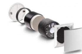
Ventilazione meccanica controllata