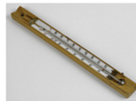
Innalzare la temperatura interna